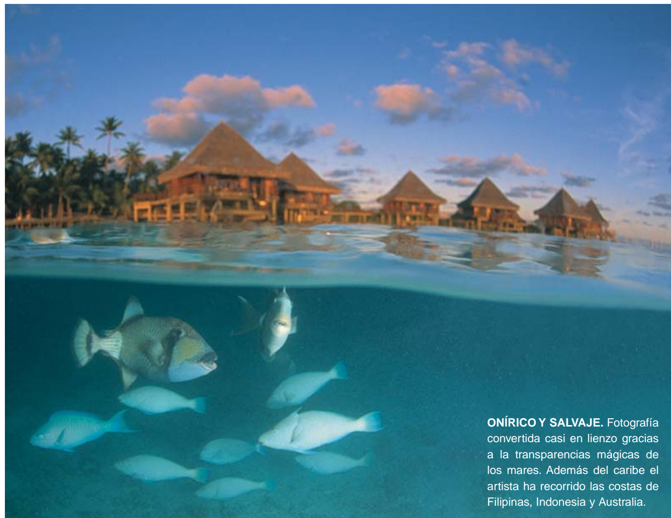
ONÍRICO Y SALVAJE. Fotografía convertida casi en lienzo gracias a la transparencias mágicas de los mares. Además del caribe el artista ha recorrido las costas de Filipinas, Indonesia y Australia.

Como fotógrafo ha recorrido los principales océanos del mundo. Se ha sumergido en las cristalinas aguas del caribe, algunas de sus mejores imágenes provienen de sus viajes a las costas del Pacífico Sur y Norte, en los mares de Australia, Indonesia y Filipinas. Ingrávida y transparente, el agua que abrumba su lente le permite extraer húmedos lienzos gráficos.