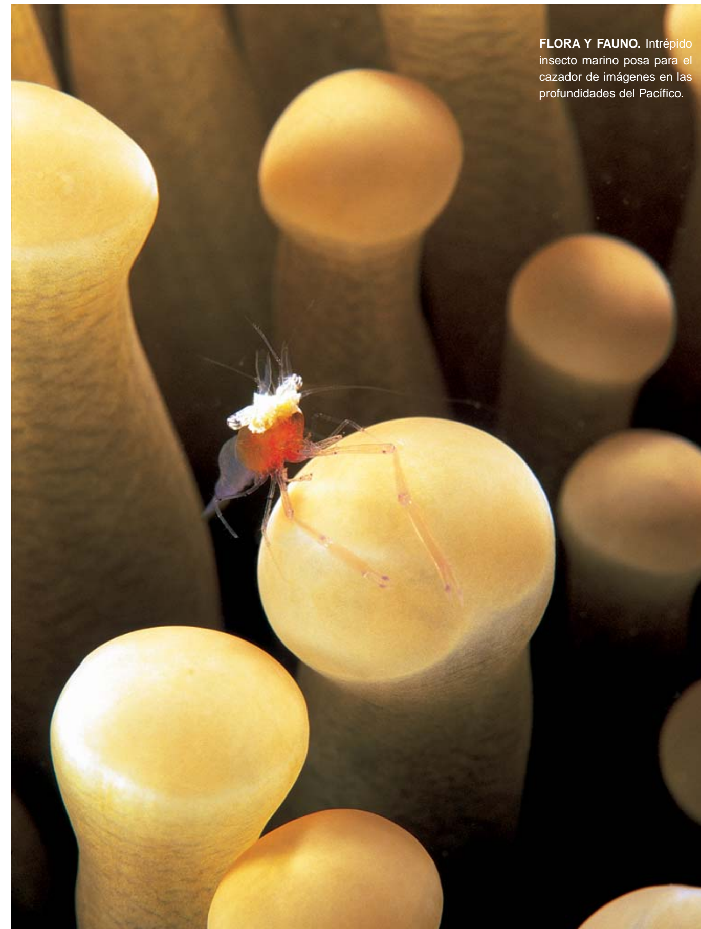
FLORA Y FAUNA. Intrépido insecto marino posa para el cazador de imágenes en las profundidades del Pacífico.

En esa búsqueda se encuentra, almacenando imágenes, algunas de las cuales se descubren en estas páginas y algunas otras en la página web diseñada por Valerie, su compañera indismallable de aventuras: www.bernardosambra.com . Y se entrega nuevamente a ese reino donde sabe que es feliz. Donde todo lo que está a la vista se le presenta como un regalo divino, donde la vida se expresa en estas coreografías imposibles y esos colores mágicos con los que ha aprendido a cazar sin arpones mortíferos, donde la presa es, tan solo, color y movimiento. ❖