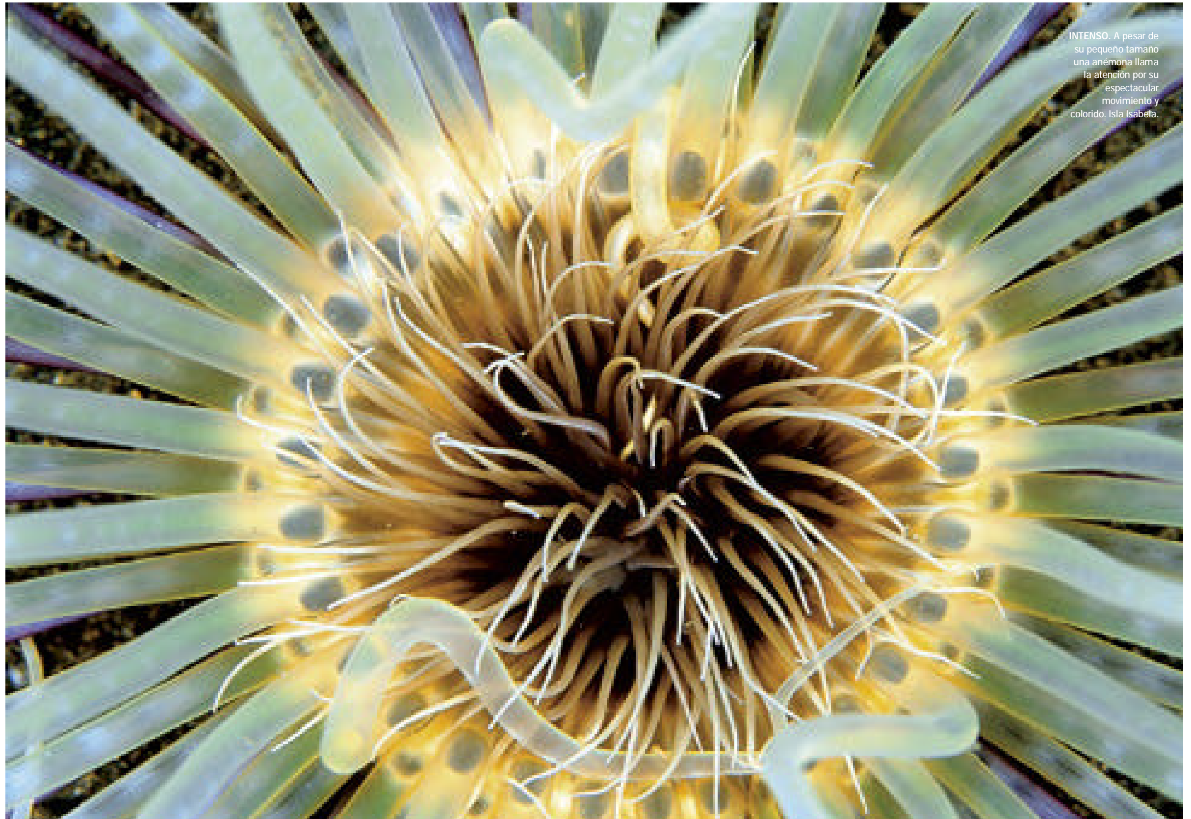
INTENSO. A pesar de su pequeño tamaño una anémona llama la atención por su espectacular movimiento y colorido. Isla Isabela.

A pesar de no tener una vasta extensión territorial, Ecuador se da el lujo de contar con cuatro regiones geográficas: costa, sierra y selva, como el Perú, a las que se agrega el archipiélago de las Galápagos, conformadas por trece islas principales, seis islas pequeñas y 42 islotes. Su nombre proviene de unas tortugas gigantes que pesan hasta 270 kilos y llegan a vivir más