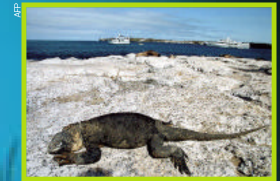
PARAISO. Un buzo contempla un enorme cardumen de barracudas que circunda la pequeña isla de Cousins Rock. Arriba, envidiable descanso de una iguana gigante bajo el Sol.

EXPEDICIONES. El fascinante y mágico mundo submarino de las Islas Galápagos