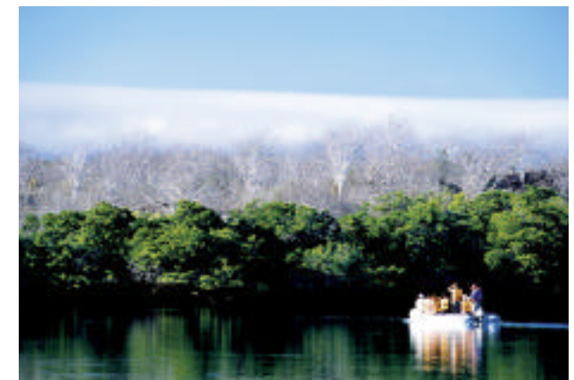
ZONA VERDE. Turistas recorriendo a bordo de un zodiac los manglares de la caleta Tortuga Negra.

A pesar de no tener un vasto territorio, Ecuador se da el lujo de contar con cuatro regiones geográficas.