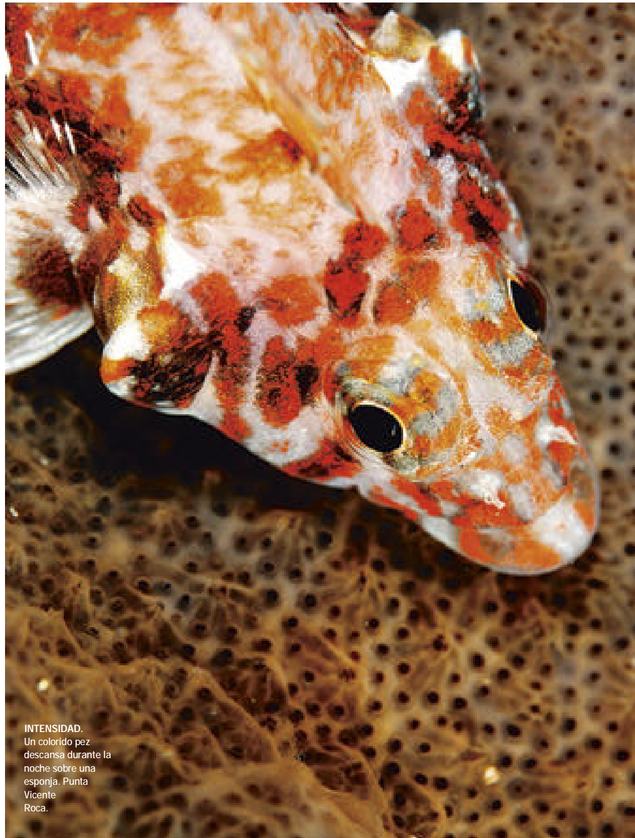
INTENSIDAD. Un colorido pez descansa durante la noche sobre una esponja. Punta Vicente Roca.