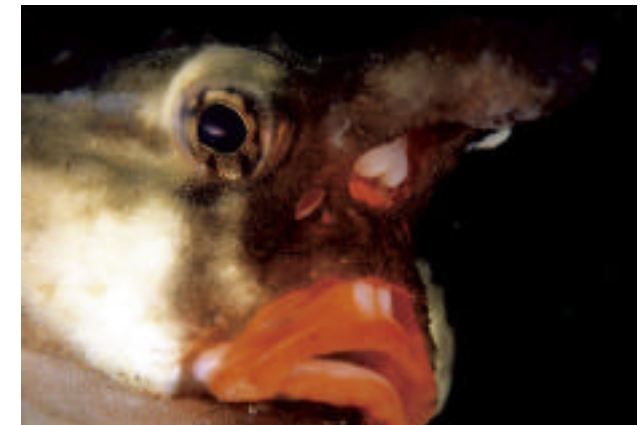
EL GRAN PEZ. Como salido de una historieta de ciencia ficción, un extraño pez murciélago de labios rojos descansa en las profundidades de la caleta Targus.

A pesar de no tener un vasto territorio, Ecuador se da el lujo de contar con cuatro regiones geográficas.