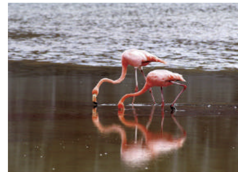
ESPECIE. Una pareja de flamencos busca langostinos en la laguna de Punta Cormorán. Arriba, el flujo de visitantes es tan grande que la infraestructura turística ha crecido para responder a la demanda.

Bernardo acudió a este santuario natural concentrado en la excepcional flora y fauna que allí habita. Fue un reto para su habilidad como buzo y fotógrafo, pues la corriente es extremadamente fuerte.