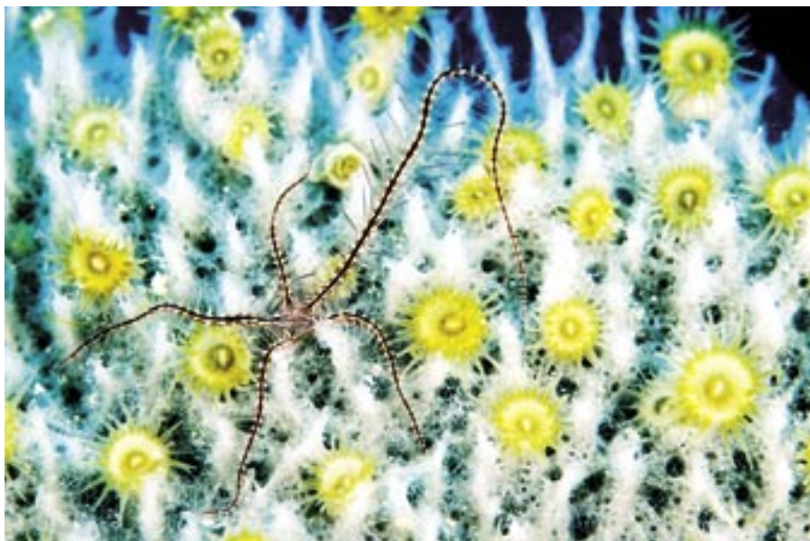
ARRIBA. Brittle Star (ophiothrix suesonii). DERECHA. Pulpo en Pucusana (Perú).